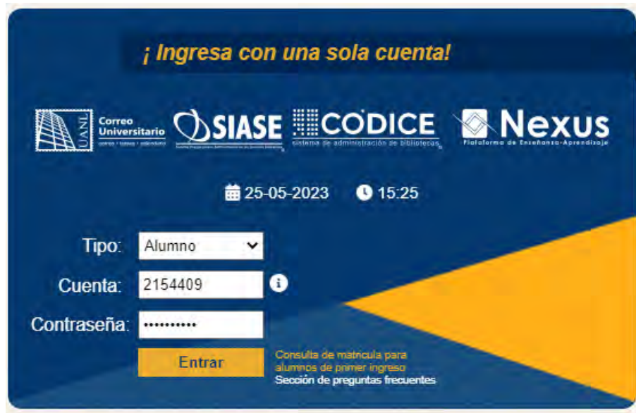
Imagen 1 - Servicios en Línea

Contraseña: Teclear la contraseña asignada.