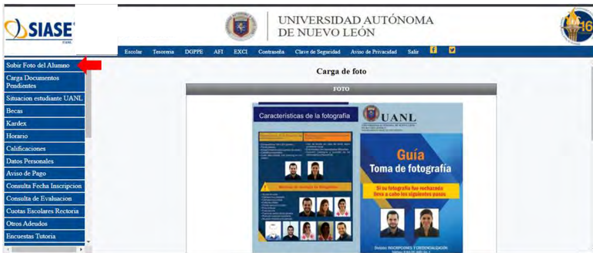
Imagen 16 - Subir Foto del Alumno

Subir Foto del Alumno y aparecerá la información sobre las características de la fotografía.