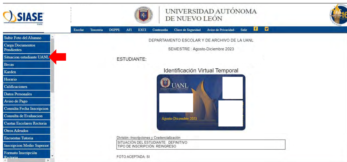
Imagen 7 - Situación estudiante UANL

En el menú del lado izquierdo debes dar clic en la opción Situación estudiante UANL para poder visualizar tu identificación virtual, además, en este apartado también puede ser posible que valides si tu fotografía es aceptada y en caso de requerir una reposición te aparecerá el estatus de la misma, en este apartado indicando fecha y hora para recoger tu credencial en la torre de Rectoría.