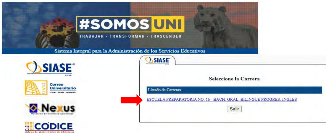
Imagen 2 - Ingresar a SIASE

Para acceder a SIASE solo es necesario dar clic en ESCUELA PREPARATORIA NO. 16 – BACH GRAL. Como se muestra en la imagen.