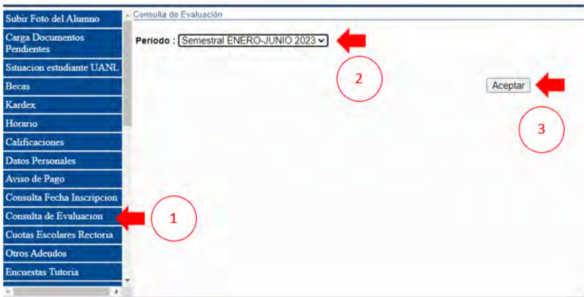
Imagen 18 - Consulta de Evaluación

En este apartado usted podrá visualizar los resultados que lleva el estudiante de la siguiente manera: