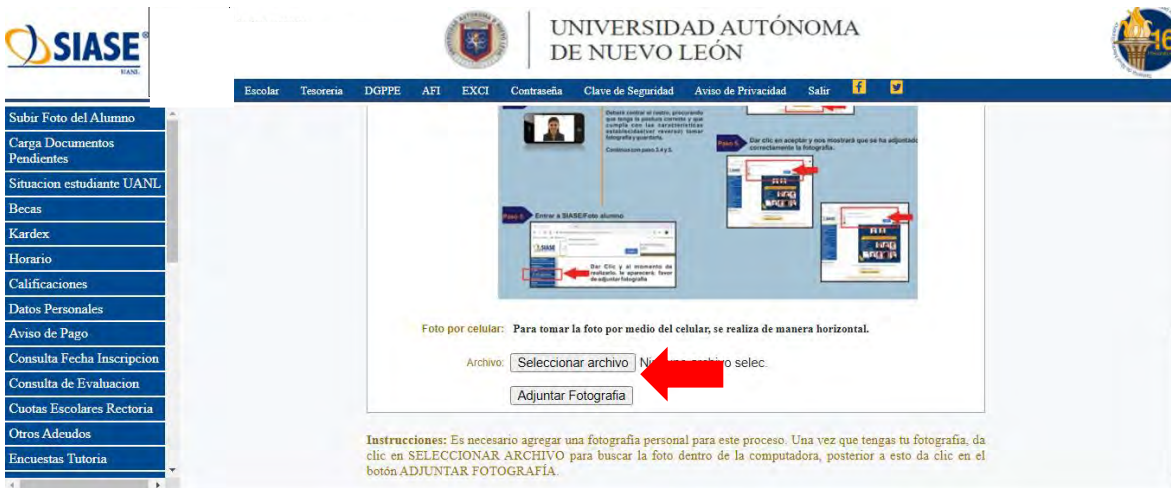
Imagen 17 - Adjuntar Fotografía

Es muy importante agregar una fotografía personal para este proceso. Una vez que tengas tu fotografía da clic en Seleccionar Archivo para buscar la foto dentro de la computadora, posterior a esto da clic en botón Adjuntar Fotografía .