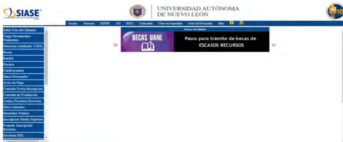
Imagen 3 - Pantalla inicial de SIASE

Hecho lo anterior aparecerá la pantalla inicial de SIASE la cual aparece a continuación: