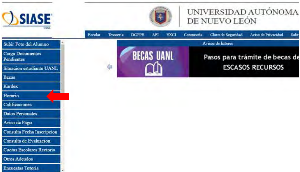
Imagen 4 - Menú Horario

Una vez que inicies sesión en SIASE debes dirigirte al menú que aparece del lado izquierdo y seleccionar la opción: Horario .